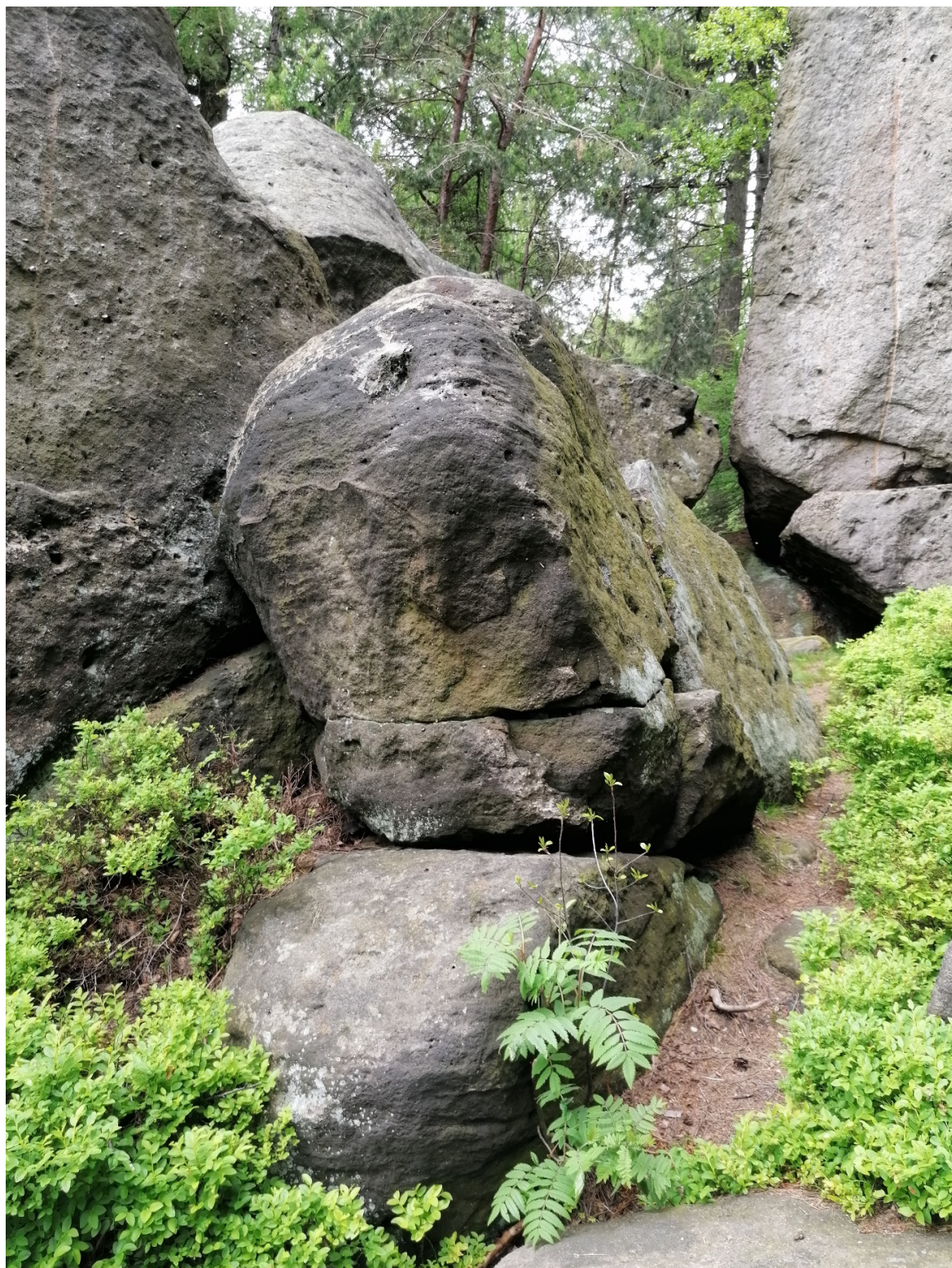
Obrázek č. 1/1