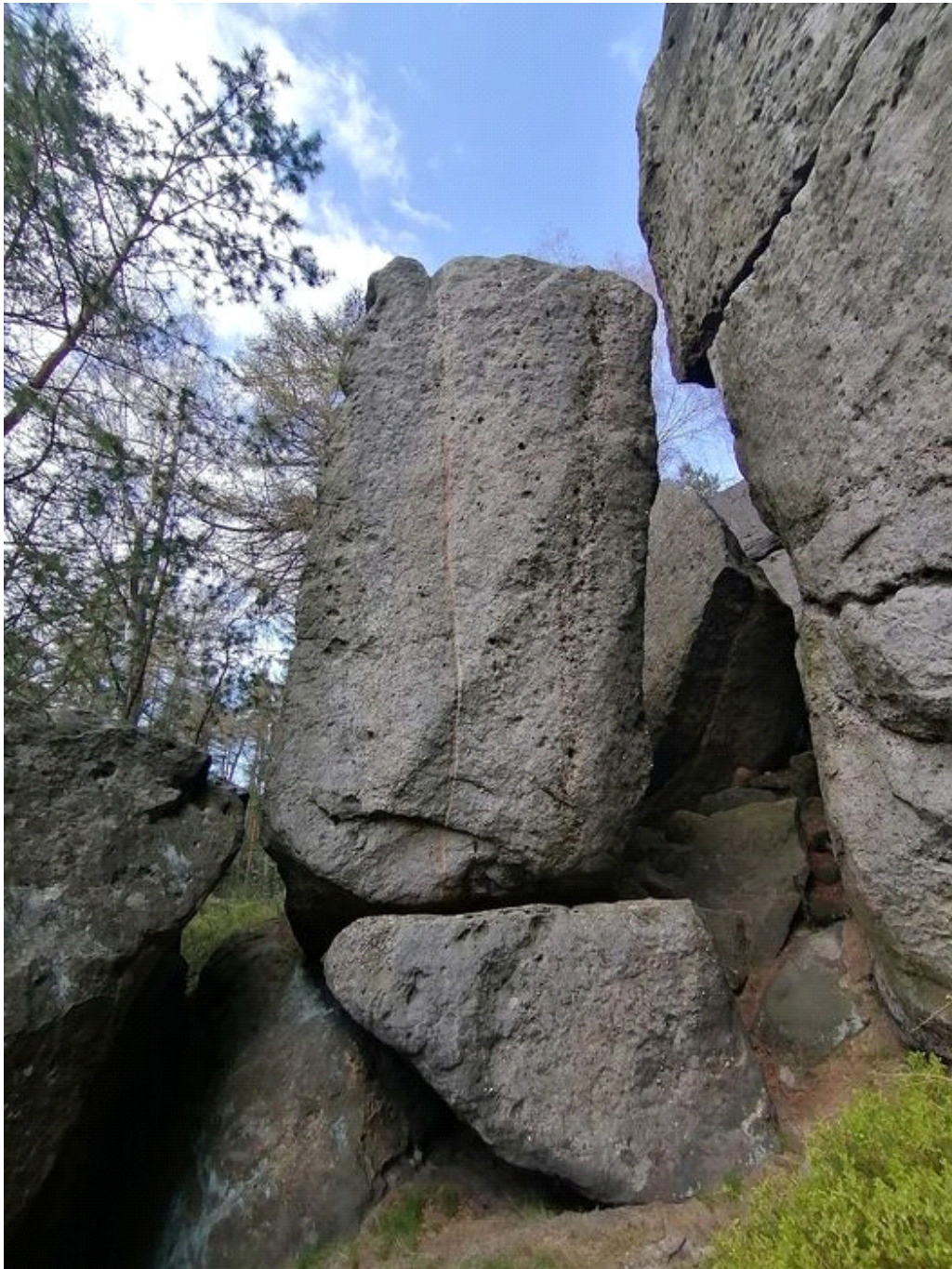
Obrázek č. 1/2