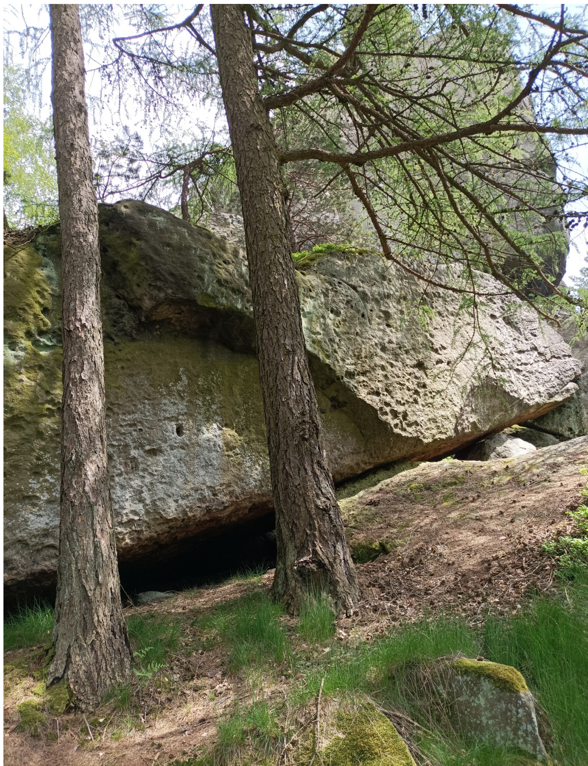
Obrázek č. 1/1