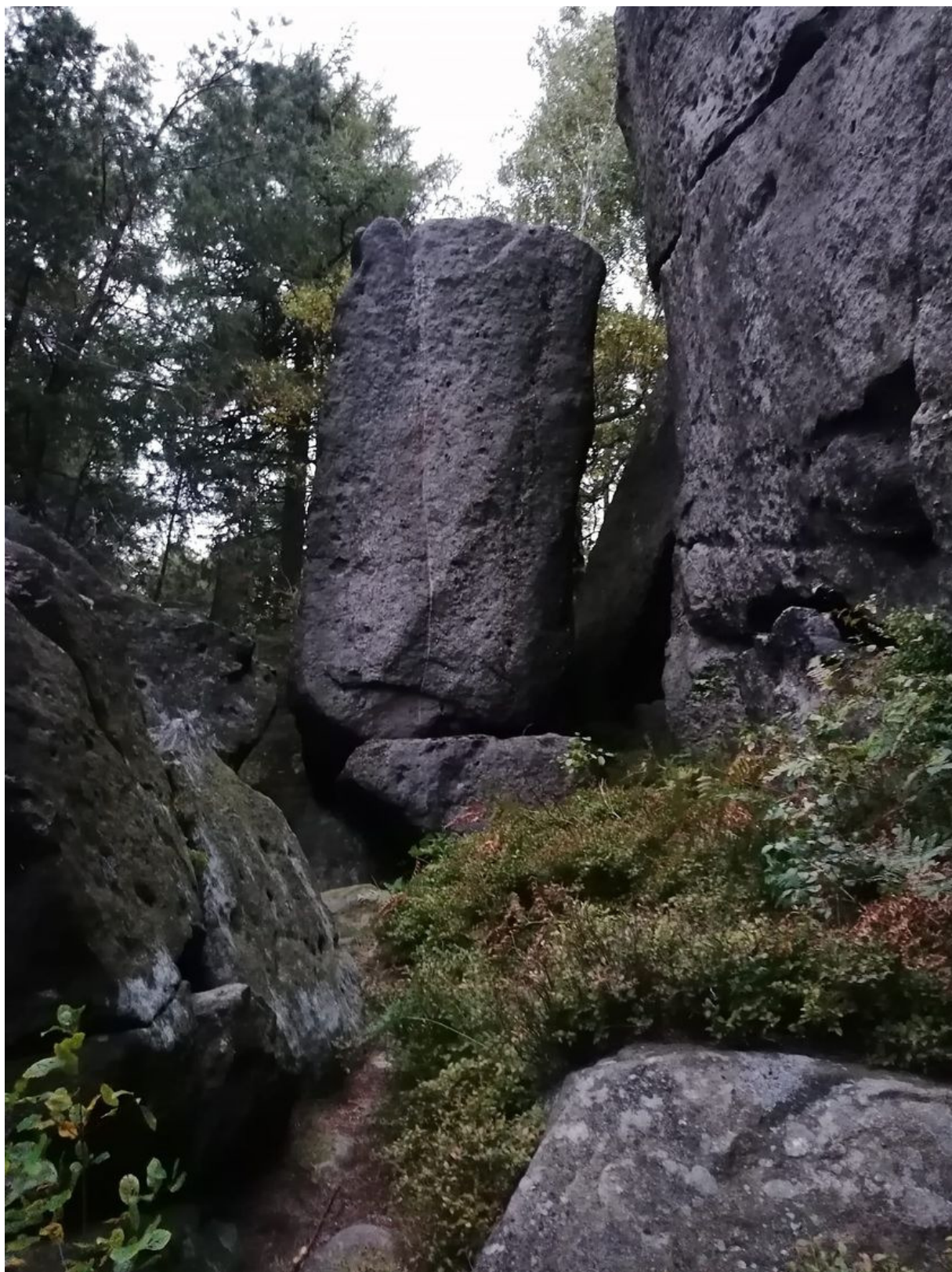
Obrázek č. 1/1