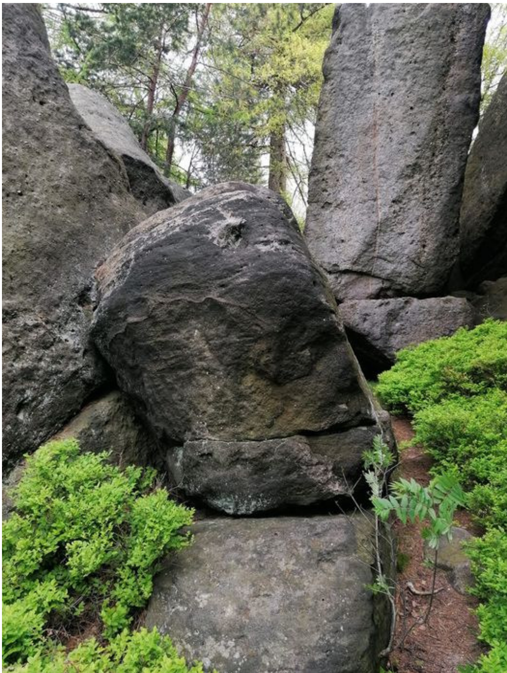
Obrázek č. 1/2